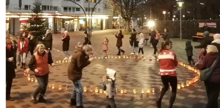
Lichter-Aktion am Orange Day

goes bang and a network against intimate partner violence should be established. Starting next year, there will be meetings for the exchange of interested parties and workshops, e.g. on the topic of civil courage, in which neighbors can participate. The first action of the new colleagues was this year's Orange Day on November 25. On the international day against partner violence, Norbert-Schmid-Platz was illuminated in orange light. The lanterns were designed beforehand in a joint handicraft activity. In addition, an orange-painted bench now stands in the square all year round to draw attention to the topic beyond the day.