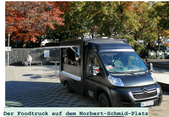
Der Foodtruck auf dem Norbert-Schmid-Platz

انتهى الانتظار الطويل. منذ أكتوبر ، هناك عرض غذاء ساخن كل يوم اثنين وأربعاء من الساعة ١١-١٤ في نوربرت شميد بلاتز. مقابل ٥,٥٠ يورو تحصل على جزء كبير ، يتوفر أيضاً خيار نباتي دائماً. نصيحتنا: أحضر صندوقك الخاص وتجنب نفايات التغليف. عربة الطعام هي مشروع تابع لـ SocialEatery لتنفيذ قانون فرص المشاركة في هامبورغ ، والذي يساعد العاطلين عن العمل على المدى الطويل في العودة إلى عالم العمل.