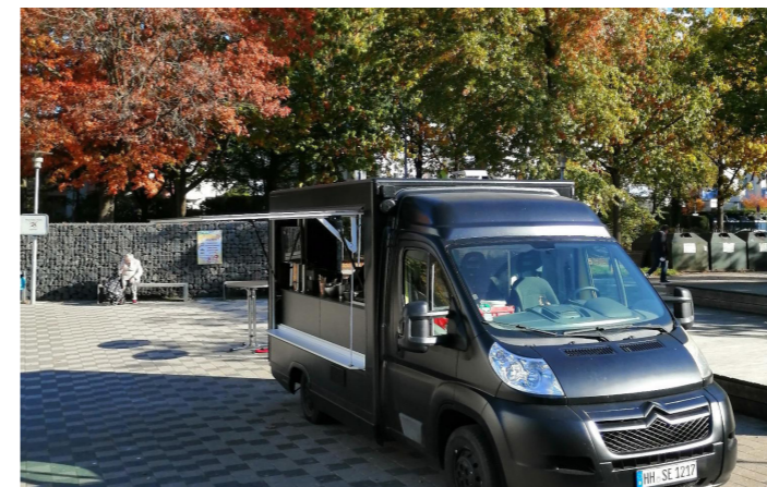
Der Foodtruck auf dem Norbert-Schmid-Platz

The long wait is over. Since October, there is a hot lunch offer every Monday and Wednesday from 11-14 o'clock on the Norbert-Schmid-Platz. For 5,50€ you get a big portion, a vegetarian option is also always on offer. Our tip: Bring your own box and avoid packaging waste. The food truck is a project of SocialEatery to implement the Participation Opportunities Act in Hamburg, which helps the long-term unemployed find their way back into the world of work.