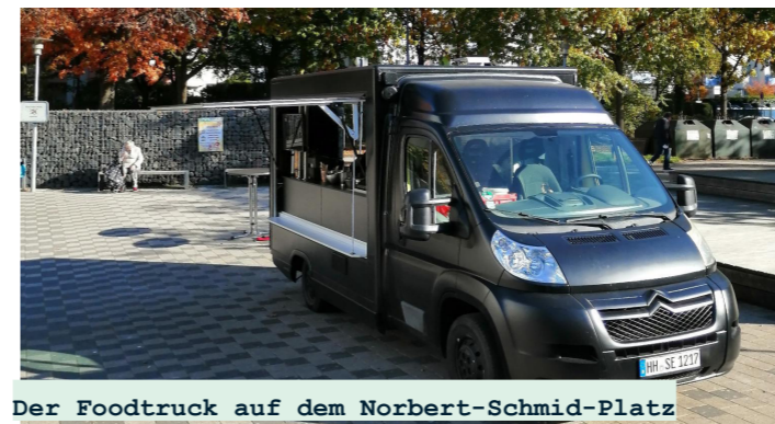
Der Foodtruck auf dem Norbert-Schmid-Platz

Der Foodtruck ist ein Projekt der SocialEatery zur Umsetzung des Teilhabechancengesetzes in Hamburg, mit dem Langzeitarbeitslose wieder den Weg zurück in die Arbeitswelt finden.