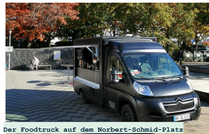
Der Foodtruck auf dem Norbert-Schmid-Platz

Długie oczekiwanie dobiegło końca. Od października w każdy poniedziałek i środę od 11 do 14 na Norbert-Schmid-Platz oferowany jest gorący lunch. Za 5, 50 € dostajesz dużą porcję, opcja wegetariańska jest również zawsze w ofercie. Nasza wskazówka: przynieś własne pudełko i unikaj odpadów opakowaniowych. Food truck to projekt SocialEatery mający na celu wdrożenie ustawy o możliwościach uczestnictwa w Hamburgu, która pomaga osobom długotrwale bezrobotnym znaleźć drogę z powrotem do świata pracy.