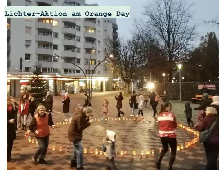
Lichter-Aktion am Orange Day

العمل ، على سبيل المثال حول موضوع الشجاعة المدنية ، حيث يمكن للجيران المشاركة. كان أول عمل قام به الزملاء الجدد هو اليوم البرتقالي لهذا العام في ٢٥ نوفمبر. وفي اليوم الدولي ضد عنف الشريك ، أضيء نوربرت شميد بلاتز بالضوء البرتقالي. تم تصميم الفوانيس مسبقاً في نشاط الحرف اليدوية المشترك. بالإضافة إلى ذلك ، يقف الآن مقعد مطلي باللون البرتقالي في المربع على مدار السنة للفت الانتباه إلى الموضوع بعد اليوم.