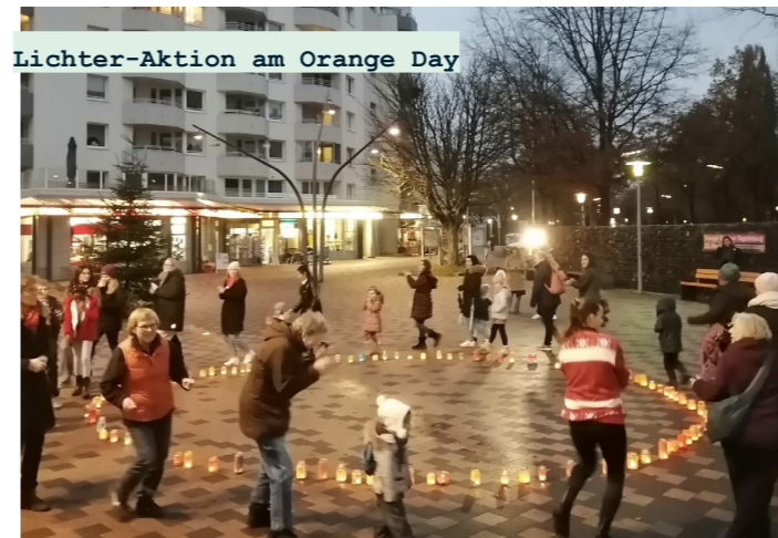
Lichter-Aktion am Orange Day

و باید شبکه ای علیه خشونت شریک جنسی ایجاد شود. از سال آینده، جلساتی برای تبادل علاقه‌مندان و کارگاه‌های آموزشی برگزار می‌شود، به عنوان مثال. در موضوع شجاعت مدنی که همسایگان می‌توانند در آن شرکت کنند. اولین اقدام همکاران جدید، روز نارنجی امسال در ۲۵ نوامبر بود. در روز جهانی مبارزه با خشونت شریک، نوربرت-اشمید-پلاتز با نور نارنجی روشن شد. فانوس‌ها از قبل در یک فعالیت مشترک صنایع دستی طراحی شده بودند. علاوه بر این، نیمکتی با رنگ نارنجی اکنون در تمام طول سال در میدان ایستاده است تا توجه را به موضوع فراتر از روز جلب کند.