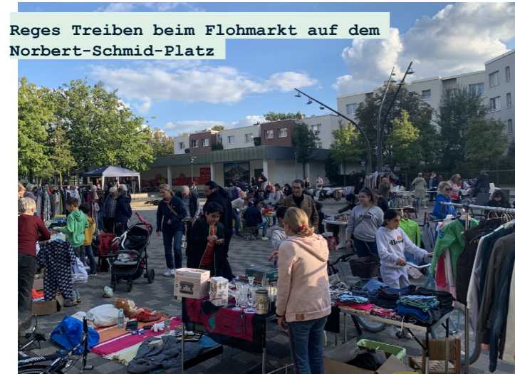
Reges Treiben beim Flohmarkt auf dem Norbert-Schmid-Platz

با مشارکت فعال ساکنان، «هفته حفاظت از آب و هوا» در اطراف نوربرت-اشمید-پلاتز در منطقه RISE از ۱۹-۲۲،۹،۲۰۲۲ برگزار شد. جمعیت بسیار زیادی در کارگاه دوچرخه سواری و بازار فروش شبانه وجود داشت. همه شرکت کنندگان رضایت خود را از روند رویدادها ابراز کردند و تصمیم گرفتند هفته آب و هوا دیگری را در سال ۲۰۲۳ برگزار کنند.