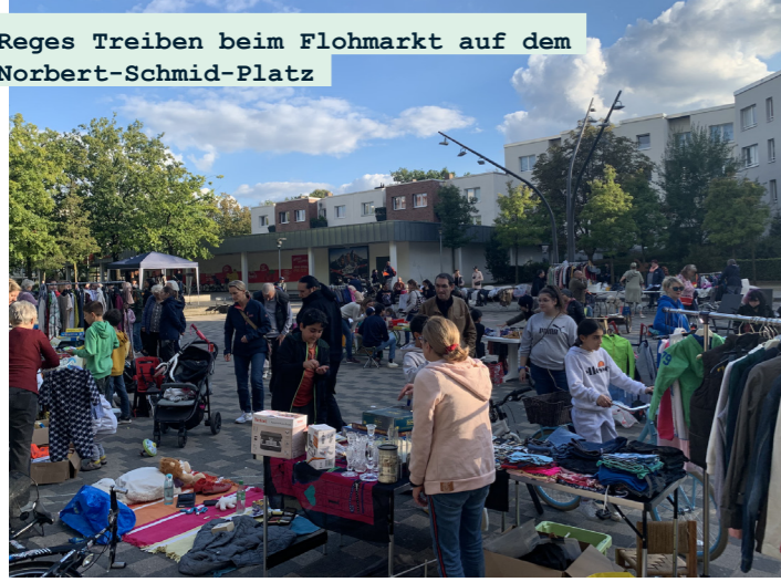
Reges Treiben beim Flohmarkt auf dem Norbert-Schmid-Platz

مشاركة نشطة من السكان ، أقيم ، «أسبوع حماية المناخ» حول نوربرت شميد بلاتز في منطقة RISE من ١٩ إلى ٢٢،٩،٢٠٢٢. كان هناك حشد كبير بشكل خاص في ورشة الدراجات وسوق البرغوث الليلي. أعرب جميع المشاركين عن رضاهم عن مسار الأحداث وقرروا تنظيم أسبوع مناخ آخر في عام ٢٠٢٣.