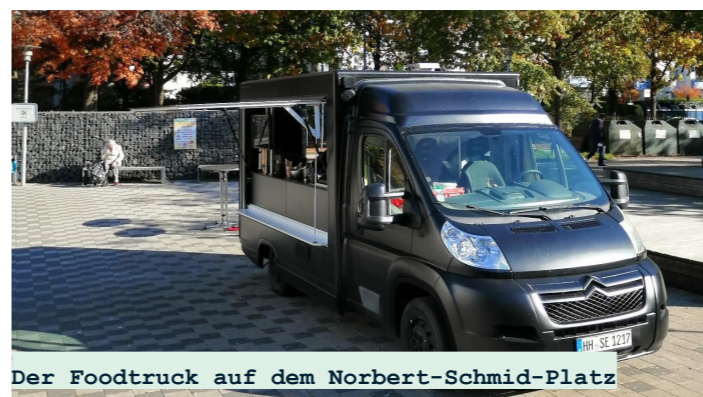
Der Foodtruck auf dem Norbert-Schmid-Platz

انتظار طولانی به پایان رسیده است. از اکتبر، هر دوشنبه و چهارشنبه یک پیشنهاد ناهار گرم از ساعت ۱۱ تا ۱۴ در نوربرت-اشمید-پلاتز وجود دارد. با ۰،۵۰ یورو، بخش بزرگی دریافت می‌کنید، یک گزینه گیاهی نیز همیشه در دسترس است. نکته ما: جعبه خود را بیاورید و از ضایعات بسته بندی خودداری کنید. کامیون غذا پروژه ای از SocialEatery برای اجرای قانون فرصت‌های مشارکت در هامبورگ است که به بیکاران طولانی مدت کمک می‌کند راه خود را به دنیای کار بازگردند.