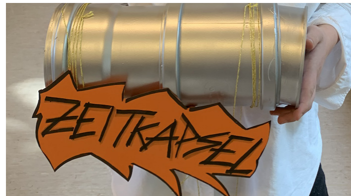
Die Zeitkapsel mit wichtigen Erinnerungen über das Haus der Jugend in 2022. Z.B. mit aktuellem Programm und selbstgeschriebenen Briefen der Kinder und Jugendlichen an die Zukunft.