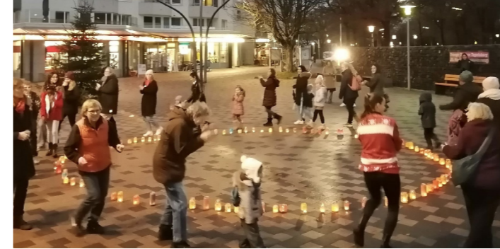
Lichter-Aktion am Orange Day

Erste Aktion der neuen Kolleginnen war der diesjährige Orange Day am 25. November. Am internationalen Tag gegen Partnergewalt, erleuchtete der Norbert-Schmid-Platz in orangem Licht. Die Windlichter wurden vorher in einer gemeinsamen Bastelaktion gestaltet. Außerdem steht nun ganzjährig eine orange angestrichene Bank auf dem Platz, um über den Tag hinaus auf das Thema hinzuweisen.