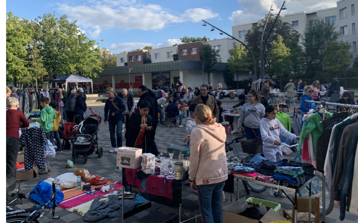
Reges Treiben beim Flohmarkt auf dem Norbert-Schmid-Platz

Mit reger Beteiligung der Anwohnenden fand vom 19.-22.9.2022 rund um den Norbert-Schmid-Platz im RISE-Gebiet die „Woche für den Klimaschutz“ statt. Besonders großer Andrang herrschte bei der Fahrradwerkstatt und dem Nachtflohmarkt. Alle Beteiligten äußerten sich sehr zufrieden über den Verlauf und haben sich vorgenommen, auch 2023 wieder eine Klimawoche zu veranstalten.