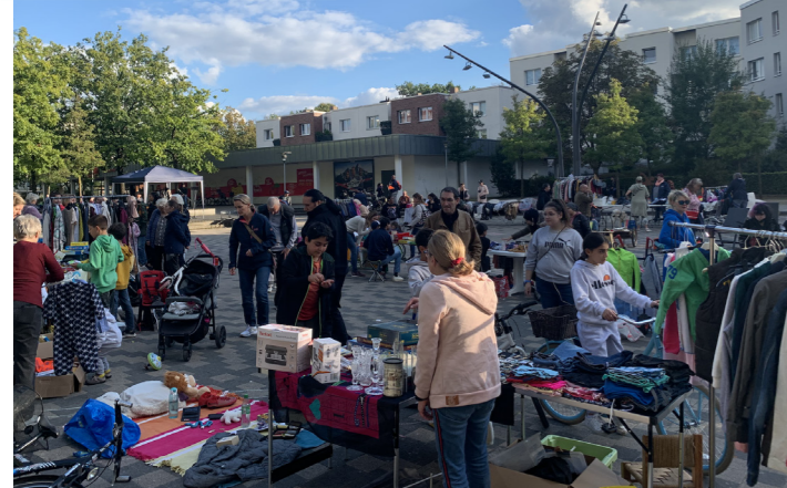
Reges Treiben beim Flohmarkt auf dem Norbert-Schmid-Platz

Przy aktywnym udziale mieszkańców wokół Norbert-Schmid-Platz na obszarze RISE w dniach 19-22 września 2022 r. odbył się „Tydzień Ochrony Klimatu”. Szczególnie licznie było w warsztacie rowerowym i nocnym pchlim targu. Wszyscy uczestnicy wyrazili zadowolenie z przebiegu wydarzeń i postanowili zorganizować kolejny Tydzień Klimatyczny w 2023 roku.