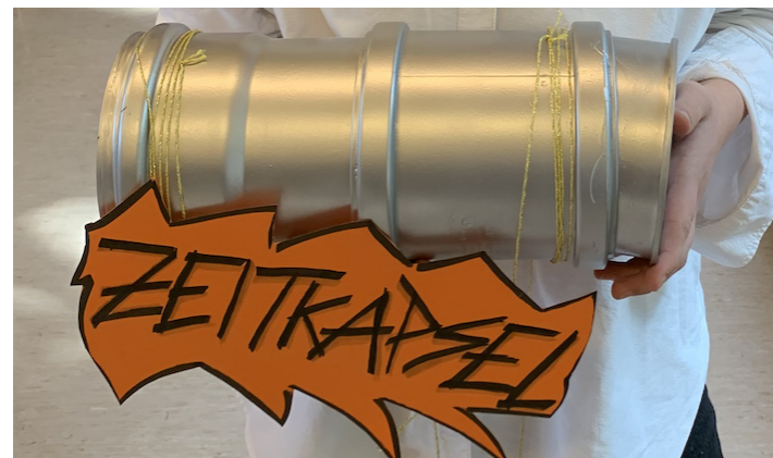
Die Zeitkapsel mit wichtigen Erinnerungen über das Haus der Jugend in 2022. Z.B. mit aktuellem Programm und selbstgeschriebenen Briefen der Kinder und Jugendlichen an die Zukunft.